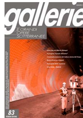
GALLERIE E GRANDI OPERE SOTTERRANEE

Abbonamento Italia: privati € 80,00; Enti Società € 99,00. Abbonamento estero: € 138,00.